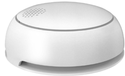
WS CO2 EK