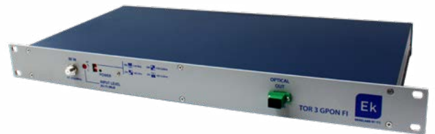
TOR 3 GPON FI