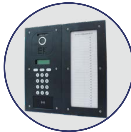
Integración con directorio PD