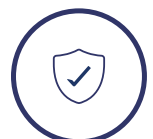
Garantía extendida (*)