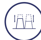
Configuración del nivel de salida de cada MUX de forma independiente