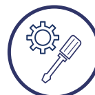
Programación manual y automática