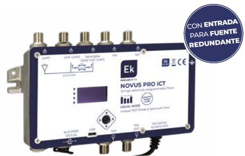
NOVUS PRO ICT