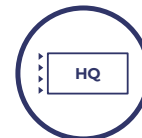
Pantalla OLED alta calidad