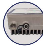
Conector Jack 2.1mm para fuente redundante