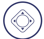
Configuración intuitiva mediante joystick multi dirección