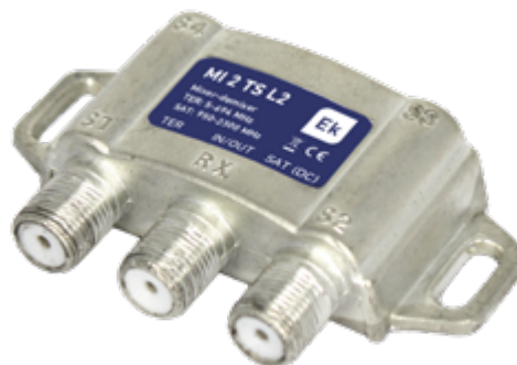
MI 2 TS L2