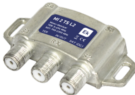
MI 2 TS L2