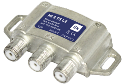
MI 2 TS L2