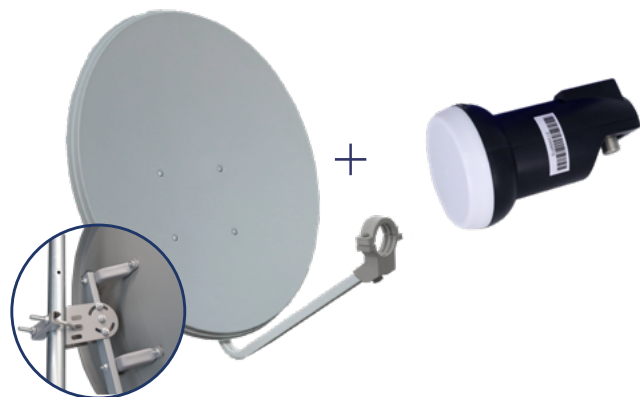
ODS60 + LNB 11