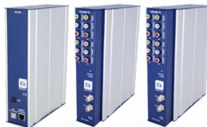
KIT CM COMPACT AV8