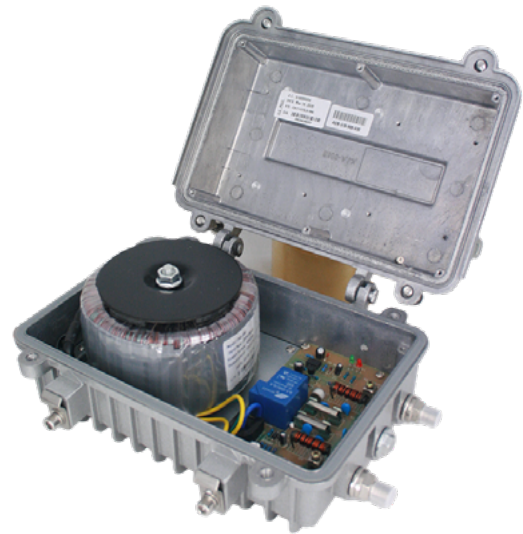
FA 6 AC