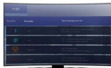
Liste classique avec les noms des chaînes