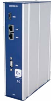
EK HEALTH EK HEALTH PRO