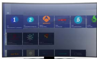
Mosaïque de logos de chaînes