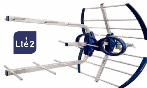
EK BLUE ACTIVE