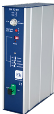
CM TO 3 FI-1310 CM TO 10 FI-1550