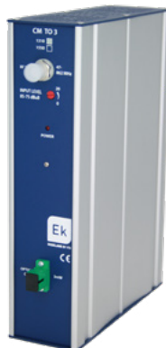
CM TO 3-1310