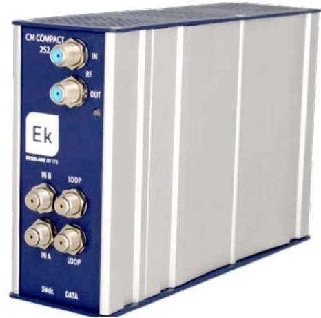
CM COMPACT 2S2