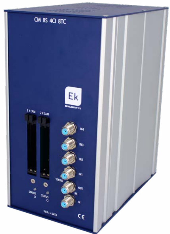
CM 8S 4CI-8TC