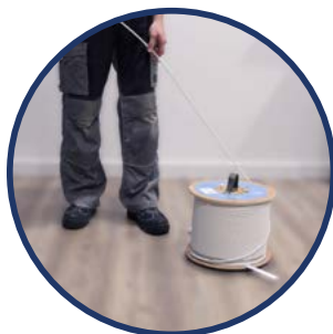
SOLUTION DE DEROULEMENT Ek ROLLER