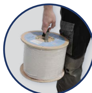
TOURET AVEC POIGNEE Ek ROLLER