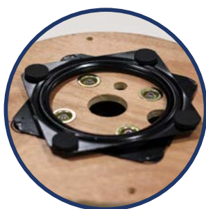
MECANISME Ek ROLLER