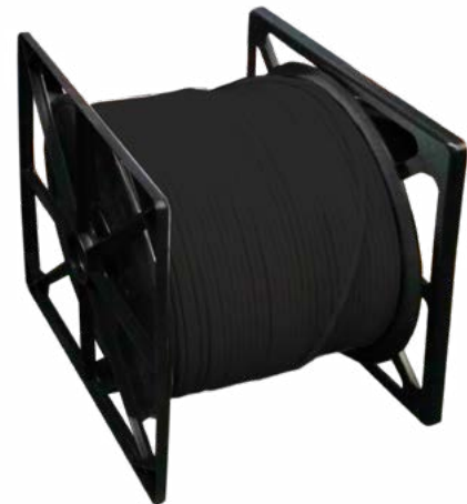
CLU 6 CU PE