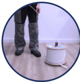
DESENROLLADO BOBINA EK ROLLER