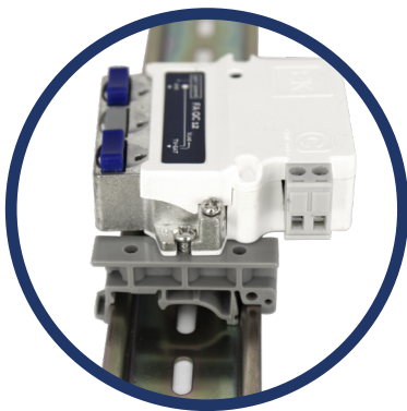
Fonte QuiCoax montada no AMCD