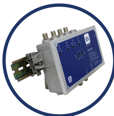
Amplificatore a banda larga montato su AMCD