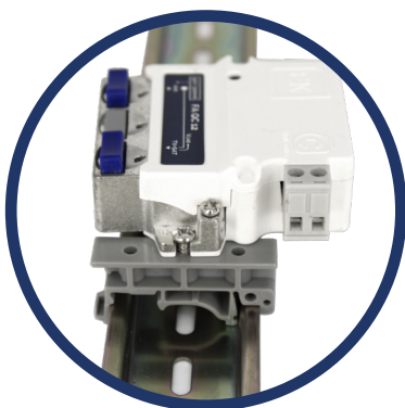
L'alimentation électrique QuiCoax montée sur AMCD