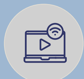
OTT - SERVICIOS DE STREAMING SOBRE WIFI