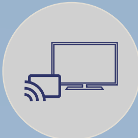
CASTING. ENTRETENIMIENTO E INTERACTIVIDAD IN-ROOM