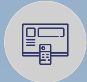
PROCESAMIENTO Y DISTRIBUCIÓN DE CANALES DE TDT, SAT E IPTV