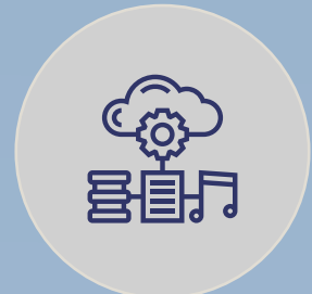
ACCESO A SERVICIOS MULTIMEDIA CON DISPOSITIVOS MÓVILES Y HOSPITALITY TV