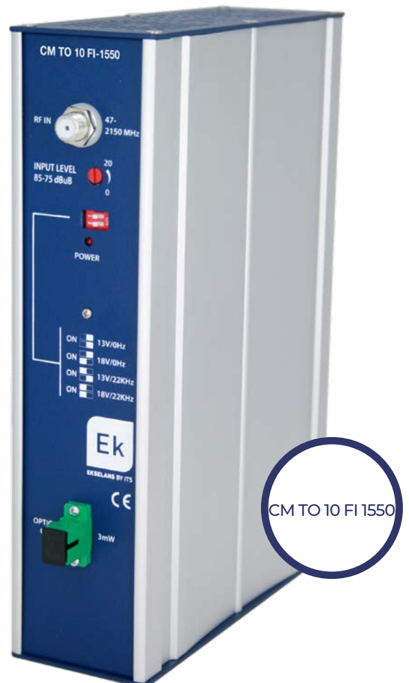
CM TO 10 FI 1550