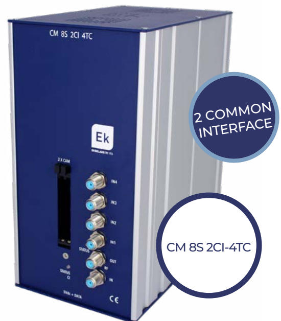
CM 8S 2CI-4TC