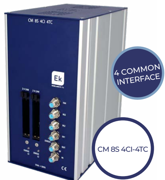
CM 8S 4CI-4TC