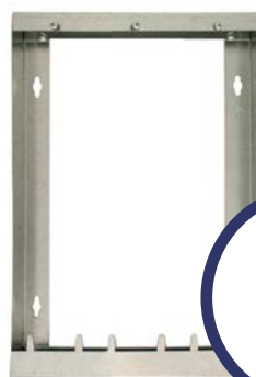
CH 3 TR