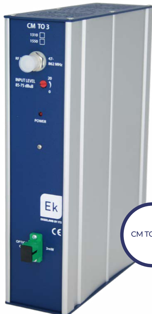
CM TO3 1310