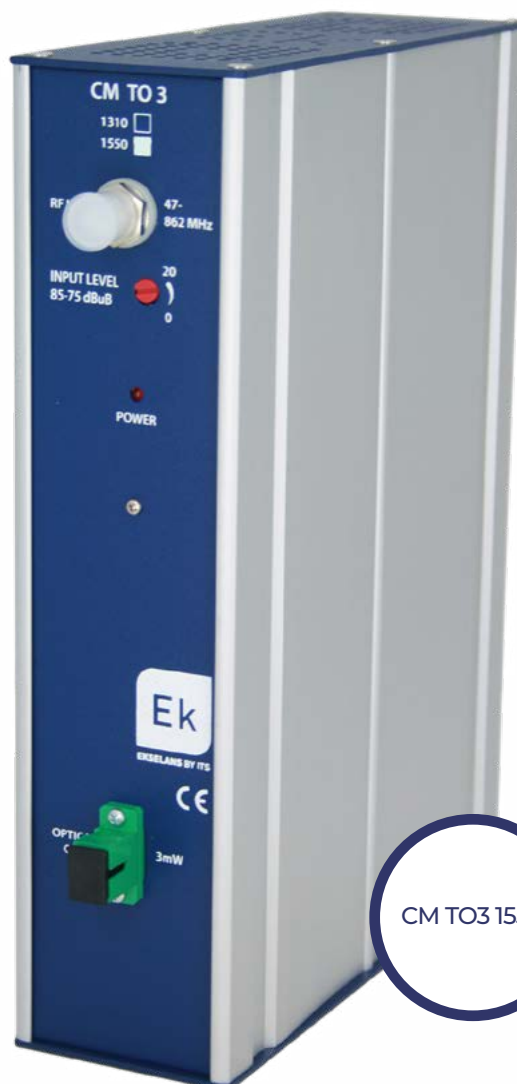
CM TO3 1550