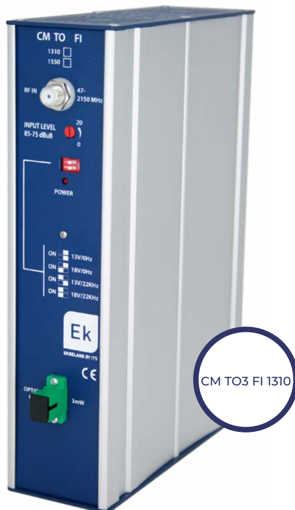
CM TO3 FI 1310