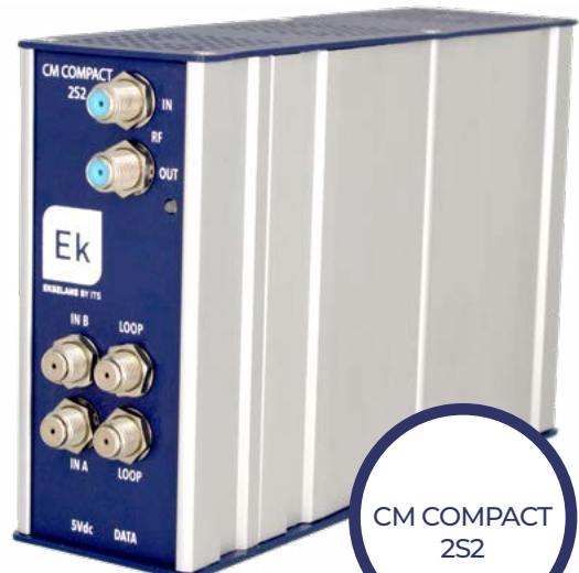
CM COMPACT 2S2