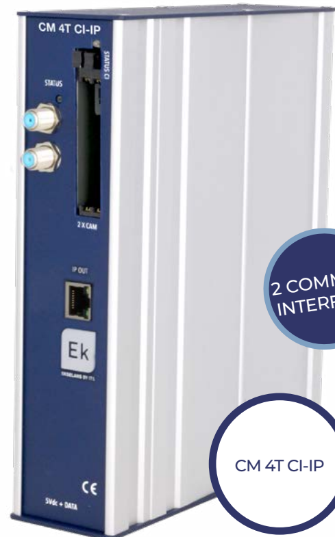
CM 4T CI-IP