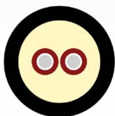
CFOR 2 900N