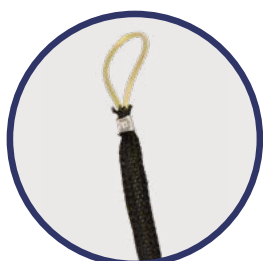
Detalhe do sistema de tração

Ek ROLLER + com acessório especial para desenrolar facilmente