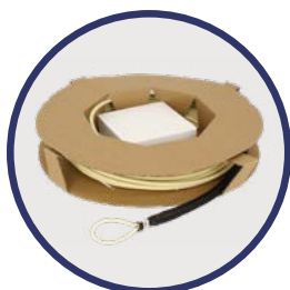
Bobina de papelão com sistema Ek ROLLER