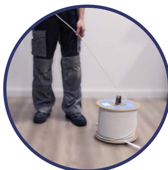
Desenrolamento da bobina EK ROLLER