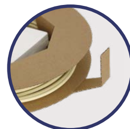
Aletas integradas na bobina