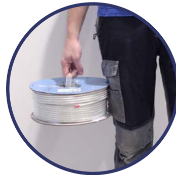
ALÇA DA BOBINA EK ROLLER