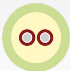
CFOR 2 900-D