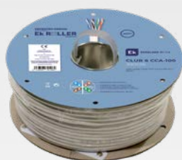
CLUR 6 CCA-100

CABOS DE DADOS Cat-6A COMPATÍVEIS COM EK ROLLER