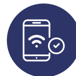
CONNECTIVITÉ RAPIDE ET SÉCURISÉE AVEC APPAREIL MOBILE (BYOD)