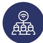
COUVERTURE WIFI EVOLUTIVE

Basé sur une technologie interne, EK dispose d'une large gamme d'équipements professionnels qui permettent la déploiement d'environnements multimédias dans les hôtels, soit en modernisant les infrastructures existantes sans qu'aucune modification importante ne soit nécessaire, soit en mettant en œuvre des systèmes FTTR (Fiber-To-The-Room) avancés sur fibre optique.