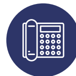
PLATEFORME DE DISTRIBUTION DE TÉLÉPHONIE IP