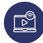
OTT – SERVICES DE STREAMING EN WIFI