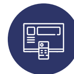
TRAITEMENT ET DISTRIBUTION DES CHÂÎNES TV, SAT ET IPTV