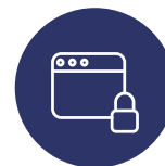
ACCÈS INTERNET SÉCURISÉ AVEC CLASSIFICATION DES INFORMATIONS ET CONTRÔLE DU RÉSEAU