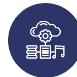
ACCÈS AUX SERVICES MULTIMÉDIAS AVEC APPAREILS MOBILES ET PAR LA TÉLÉVISION DE L'HÔTEL