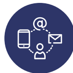
CREATION DE CANAUX D'INFORMATION